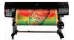
طابعة الصور HP Designjet Z6 100 مقاس ١٥٢٤ مم