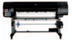
طابعة الصور HP Designjet Z6 100ps مقاس ١٥٢٤ مم