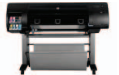
طابعة الصور HP Designjet Z6 100ps مقاس ١٠٦٧ مم