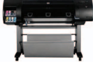
طابعة الصور HP Designjet Z6100ps مقاس ١٠٦٧ مم (Q6653A)