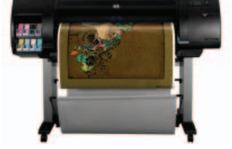
طابعة الصور HP Designjet Z6100 مقاس ١٠٦٧ مم (Q6651A)