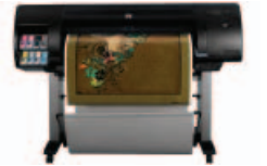
طابعة الصور HP Designjet Z6 100 مقاس ١٠٦٧ مم

٣ تتطلب الطابعات التي لا تعمل بنظام Adobe PostScript استخدام الحل المتقدم لضبط أنماط الألوان من HP، أو برنامج معالجة الصور RIP من شركة أخرى، بحيث يدعم ضبط أنماط مواد الطباعة.