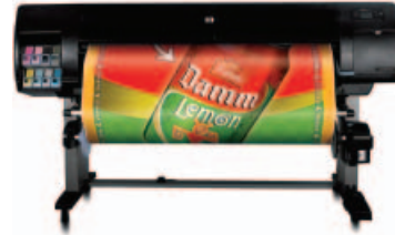
طابعة الصور HP Designjet Z6100 مقاس ١٥٢٤ مم (Q6652A)