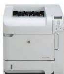
Imprimante HP LaserJet P4014dn