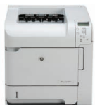
Принтер HP LaserJet P4014dn

Управление печатью и обслуживание принтера без помощи ИТ-специалистов. Настройка принтера и устранение неполадок легко выполняются благодаря функции отображения инструкций на панели управления. Устранение перерывов в работе и повышение производительности: ПО HP Easy Printer Care 3 позволяет держать под наблюдением до 15 принтеров HP LaserJet одновременно. Использование одного драйвера – универсальный драйвер печати HP 4 взаимодействует с каждым устройством HP сети напрямую и настраивает пользовательский интерфейс для отображения доступных функций.