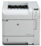
Принтер HP LaserJet P4014

Идеальное решение для рабочих групп 5 – 10 человек в малых и средних компаниях, которым необходимо печатать множество документов профессионального качества.