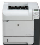
Stampante HP LaserJet P4515n

Una scelta eccellente per grandi gruppi di lavoro con un minimo di 15 utenti per stampante in ambienti gestiti di PMI e grandi aziende che necessitano di una stampante LaserJet molto affidabile, ad elevate prestazioni, protetta e facilmente gestibile.