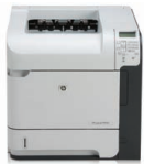
Принтер HP LaserJet P4515n