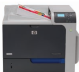
HP Color LaserJet Enterprise CP4525dn printer