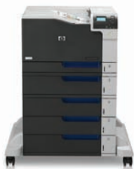
Impressora HP LaserJet a cores Enterprise CP5525xh