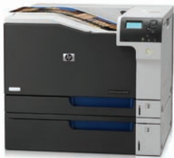
Impressora HP LaserJet a cores Enterprise CP5525dn