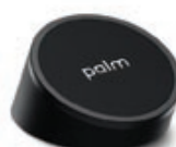
HP Touchstone autonome FB338AA