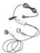
Casque stéréo HP 3,5 mm FB333AA