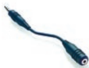
Adaptateur audio TTY HP FB374AA