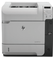
Impresora HP LaserJet Enterprise 600 M602n

Comparta esta impresora con grupos de trabajo para reducir costos y aumentar la productividad. Enfrente sus necesidades diarias de impresión, influenciando los hábitos y controlando el acceso a impresión con criterios personalizados e impresión segura tipo "Pull printing".