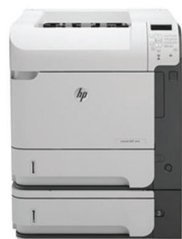
Impresora HP LaserJet Enterprise 600 M603xh