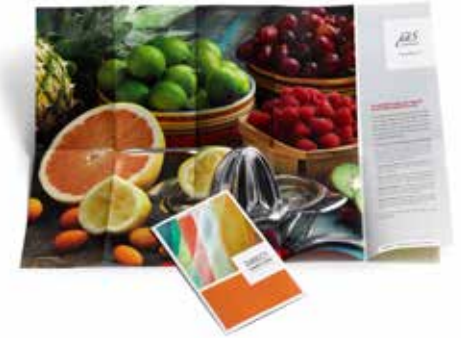
Correo directo. Pósteres de gran tamaño