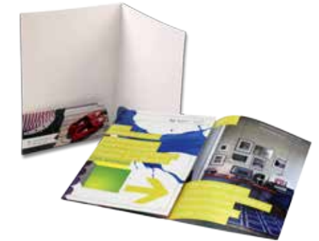
Nuevas oportunidades de marketing. Carpetas con bolsillos y folletos plegados de 6 páginas.

Utilice productos HP SmartStream y soluciones de partners con la prensa digital HP Indigo 10000 para mejorar la eficiencia de la producción y respaldar el crecimiento digital. Para obtener más información, visite hp.com/go/smartstream