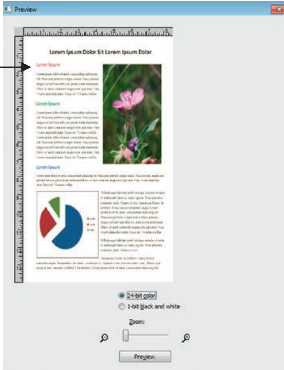
الرسم التوضيحي 3 معاينة تأثير الإعدادات الحالية

نافذة معاينة حرة اختيارية، تتضمن إمكانية التكبير والتصغير