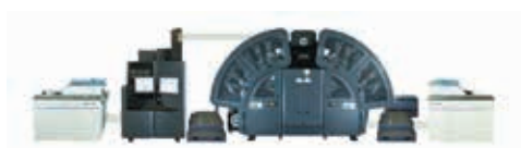
HP PageWide Rollendruckmaschine T200