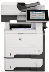
HP LaserJet Enterprise 500 M525f MFP