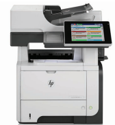
HP LaserJet Enterprise flow M525c MFP