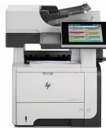
HP LaserJet Enterprise 500 M525dn MFP