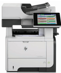
HP LaserJet Enterprise flow M525c MFP