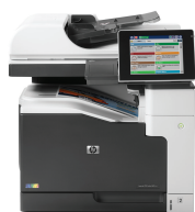
Imprimante multifonctions couleur HP LaserJet Enterprise 700 M775dn

Facilitez l'impression en couleur de qualité professionnelle de grands volumes de documents sur une large gamme de formats de papier jusqu'à , avec une capacité allant jusqu'à 4350 feuilles 1 . Gérez de façon centralisée des politiques d'impression. Protégez les informations sensibles concernant l'entreprise.