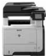
HP LaserJet Pro MFP M521DN