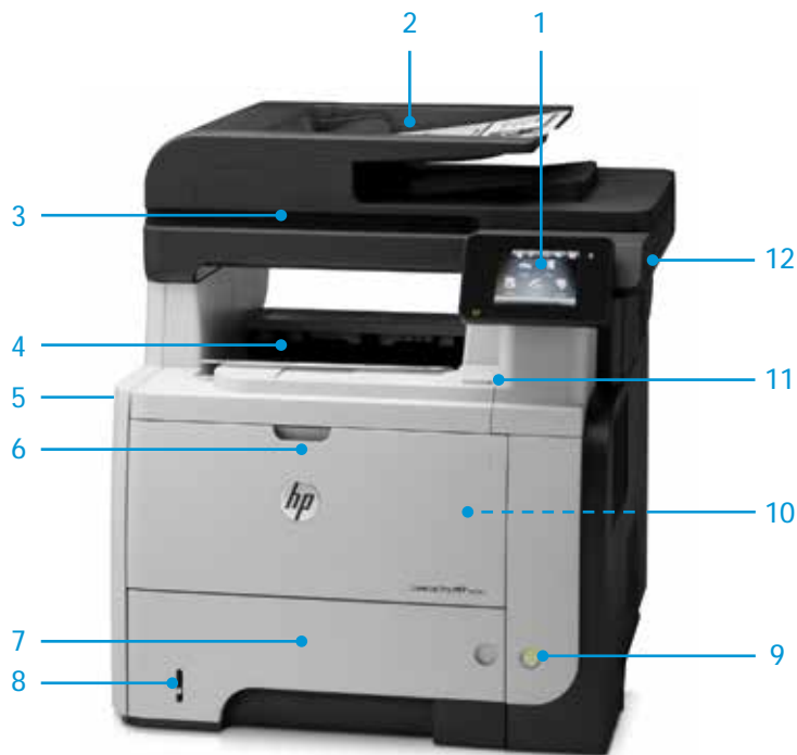
Ansicht von vorn