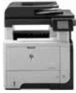
HP LaserJet Pro MFP M521dn