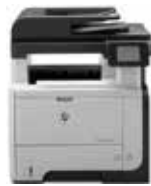
HP LaserJet Pro MFP M521dw