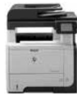
HP LaserJet Pro MFP M521dw