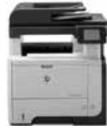
HP LaserJet Pro MFP M521dw