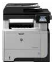
HP LaserJet Pro MFP M521dn