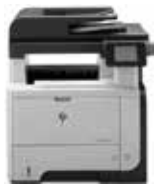
HP LaserJet Pro MFP M521dn