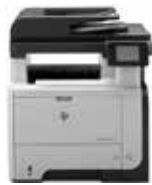
HP LaserJet Pro MFP M521dn