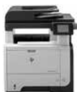
HP LaserJet Pro MFP M521dn