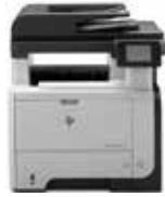
HP LaserJet Pro MFP M521dn