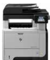
HP LaserJet Pro MFP M521dn