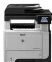
HP LaserJet Pro MFP M521dw