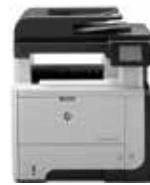
HP LaserJet Pro MFP M521dw