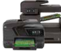
سلسلة HP Officejet Pro 200 X و