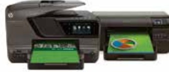
سلسلة OJ Pro 8600 ePrinter 8100 و eAiO