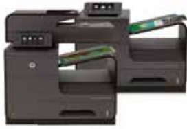
طابعات OJ Pro X 476/576 المتعددة الوظائف و طابعات X 451/551

احصل على سرعات مذهلة وخفض تكلفة الطباعة للصفحة