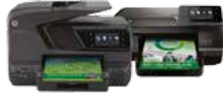
طابعة OJ Pro 276dw المتعددة الوظائف وطابعة 251dw

احصل على سرعات مذهلة وخفض تكلفة الطباعة للصفحة