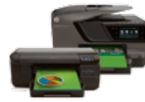
سلسلة HP Officejet Pro 8100 و 8600