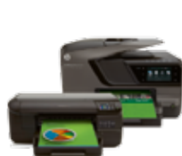
Gamme HP Officejet Pro 8100 et 8600