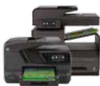
Gammes HP Officejet Pro Série 200 et Série X