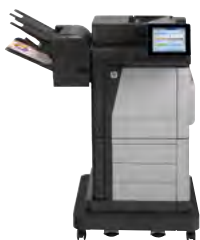
Imprimante multifonction HP Color LaserJet Enterprise Flow M680z