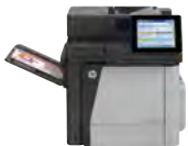
Imprimante multifonction HP Color LaserJet Enterprise M680dn

Maîtrisez les tirages élevés grâce à une imprimante multifonction couleur aux excellentes performances. Non seulement vous pouvez imprimer et copier sur du papier de types Lettre et A4, mais vous pouvez aussi numériser et télécopier. La numérisation optimisée et l'écran tactile couleur de 20,3 cm (8 po) rationalisent les flux de production. Les options d'impression mobile contribuent à maintenir votre productivité lors de vos déplacements 2,8 .