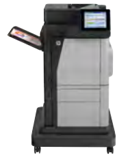
Imprimante multifonction HP Color LaserJet Enterprise M680f