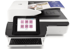
HP ScanJet Enterprise Flow Scanner

5000 s4, 7000 s3, 7500, N9120, N9120 fn2