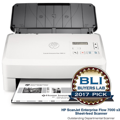
HP ScanJet Enterprise Flow 7000 s3 Sheet-feed Scanner Outstanding Departmental Scanner

Für die optimale Nutzung von Informationen benötigen Unternehmen innovative Methoden, um digitale Inhalte im gesamten Unternehmen effizient erfassen, verwalten und weitergeben zu können. Das Portfolio der HP Flow-Geräte lässt sich nahtlos mit führenden Workflow-Lösungen verknüpfen und trägt auf diese Weise zur Kostensenkung und Produktivitätssteigerung bei.