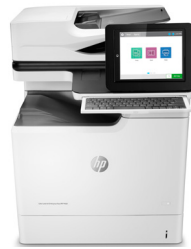
HP LaserJet/PageWide Enterprise Flow MFP

LaserJet M527c/z, M631h, M632z, M633z, M830z; Color LaserJet M577c/z, M681z, M682z, M880z; PageWide Color 586z, 785f, 785zs, 785z+