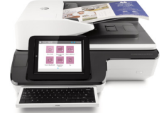
HP ScanJet Enterprise Flow Scanner

5000 s4, 7000 s3, 7500, N9120, N9120 fn2