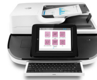
HP Digital Sender Flow Document Capture Workstation

LaserJet M527c/z, M631h, M632z, M633z, M830z; Color LaserJet M577c/z, M681z, M682z, M880z; PageWide Color 586z, 785f, 785zs, 785z+