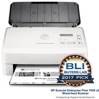
HP ScanJet Enterprise Flow 7000 s3 Sheet-feed Scanner Outstanding Departmental Scanner

Para optimizar el valor de la información, las empresas necesitan mejorar su capacidad para capturar, gestionar y compartir eficientemente los contenidos digitales a lo largo y ancho de toda la organización. La cartera de dispositivos HP Flow se integra perfectamente con soluciones líderes de flujo de trabajo para ayudarle a reducir los costes e incrementar la productividad.