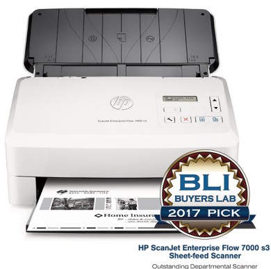
HP ScanJet Enterprise Flow 7000 s3 Sheet-feed Scanner Outstanding Departmental Scanner

Per massimizzare il valore delle informazioni, le aziende necessitano di capacità avanzate per acquisire, gestire e condividere in modo efficiente il contenuto digitale in tutta l'organizzazione. Il portfolio HP di dispositivi Flow si integra in modo trasparente con le soluzioni leader per flusso di lavoro per contribuire a ridurre i costi e aumentare la produttività.