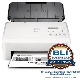
HP ScanJet Enterprise Flow 7000 s3 Sheet-feed Scanner Outstanding Departmental Scanner