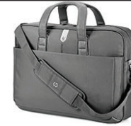
תיק HP Professional Slim Top Load Case

קבל תיקון ביום העבודה הבא באתר הלקוח למשך 3 שנים מטכנאי מוסמך של HP עבור התקן המחשוב שבדירתך, אם התקלה אינה ניתנת לפתרון מרחוק