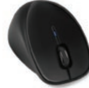
עכבר HP Comfort Grip Wireless Mouse

בצע קיבוע של המחשב HP Ultrabook™ או המחשב הנייד במהירות ובקלות באמצעות מנעול הכבל HP UltralSlim Keyed Cable Lock.