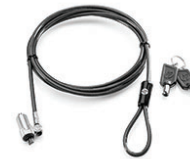
מנעול כבל HP UltralSlim Keyed Cable Lock

תיק תיקון של המחשב HP Professional Slim Top Load Case מאפשר לך לאחסן תיקיות ומסמכים אחרים והוא כולל אזורי אחסון עבור כרטיסי ביקור, מחשבי כף-יד, טלפונים סלולריים, עטים, מחבר AC ופריטים נוספים שאתה זקוק להם כאשר אתה נמצא מחוץ לבית או למשרד במשך תקופות ארוכות. מתוכנן עבור אנשי מקצוע ניידים במיוחד הנמצאים בדרכים לעיתים תכופות ולתקופות זמן ממושכות.