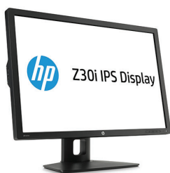
Tabela de especificações