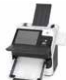
Workstation di acquisizione documenti Scanjet Enterprise 7000n/nx