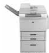
MFP M9040 / MFP M9050