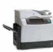
MFP 4345 / MFP M4345