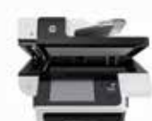
Workstation di acquisizione documenti Digital Sender Flow 8500 fn1