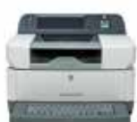
Digital Sender 9250c