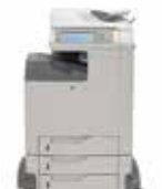
MFP 4730 / MFP CM4730