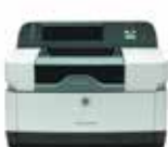
Digital Sender 9200c