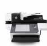
Scanjet Enterprise 8500 fn1 Workstation di acquisizione documenti