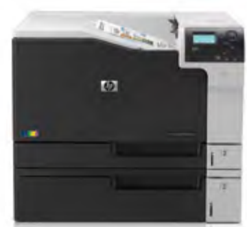
HP Color LaserJet Enterprise M750n

Fonctionnalité d'impression mobile 10 : HP ePrint, Apple AirPrint MC