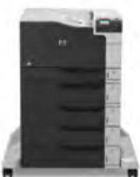
HP Color LaserJet Enterprise M750xh