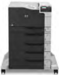
HP Color LaserJet Enterprise M750dn