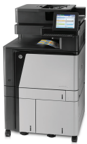
Imprimante MFP HP Color LaserJet Enterprise flow M880z+ NFC/sans fil direct