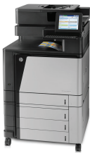
Imprimante multifonction HP Color LaserJet, flux Enterprise M880z

Cette imprimante multifonction haut de gamme professionnelle vous aide à rationaliser vos flux de travail et à accélérer le traitement de vos documents grâce aux options de finition avancées et au partage de fichiers. Offrez aux utilisateurs un accès direct et aisé à cette imprimante multifonction via l'impression mobile et la technologie toucher pour imprimer. 6