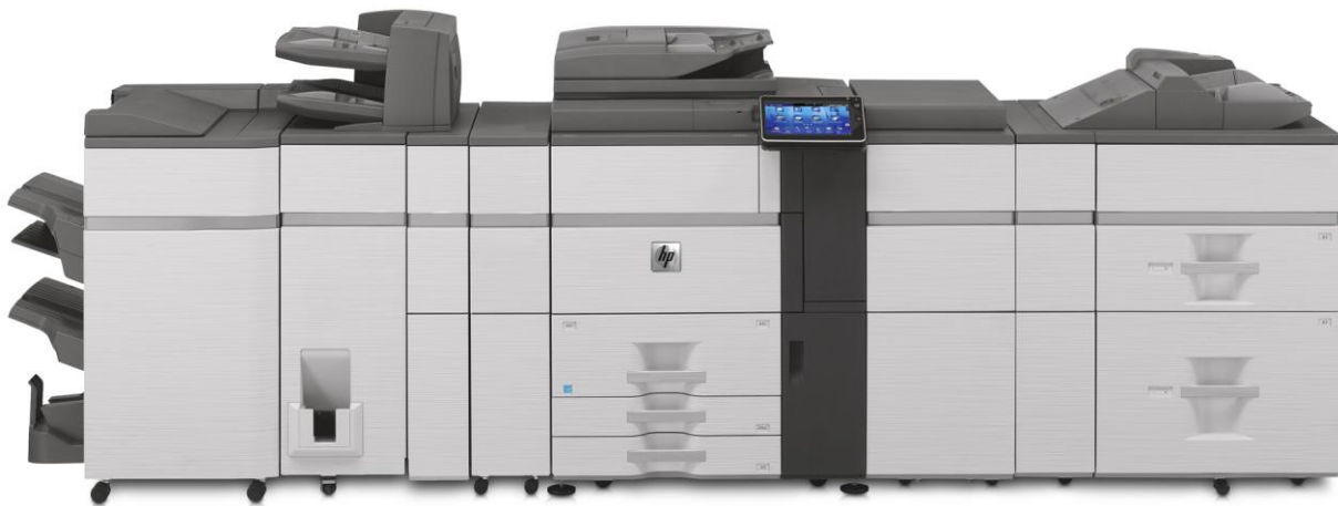
HP Color MFP S970dn – Beispielkonfiguration