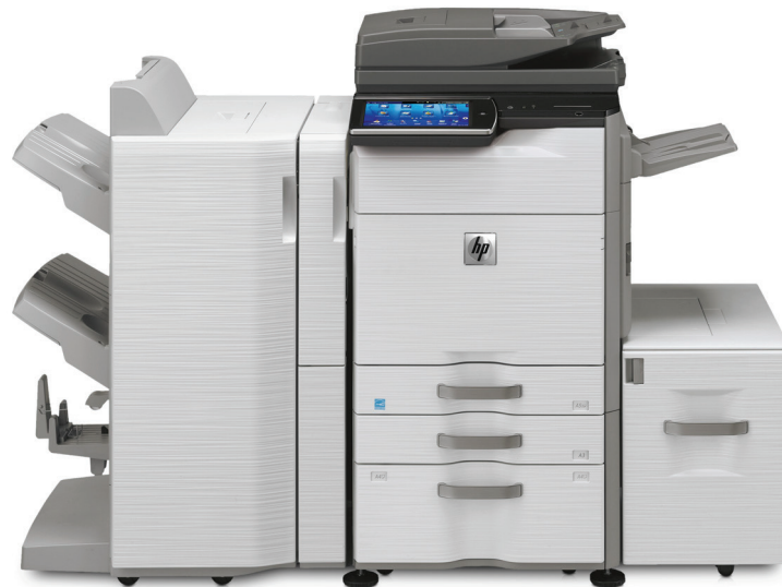
HP MFP S956dn – Exemple de configuration