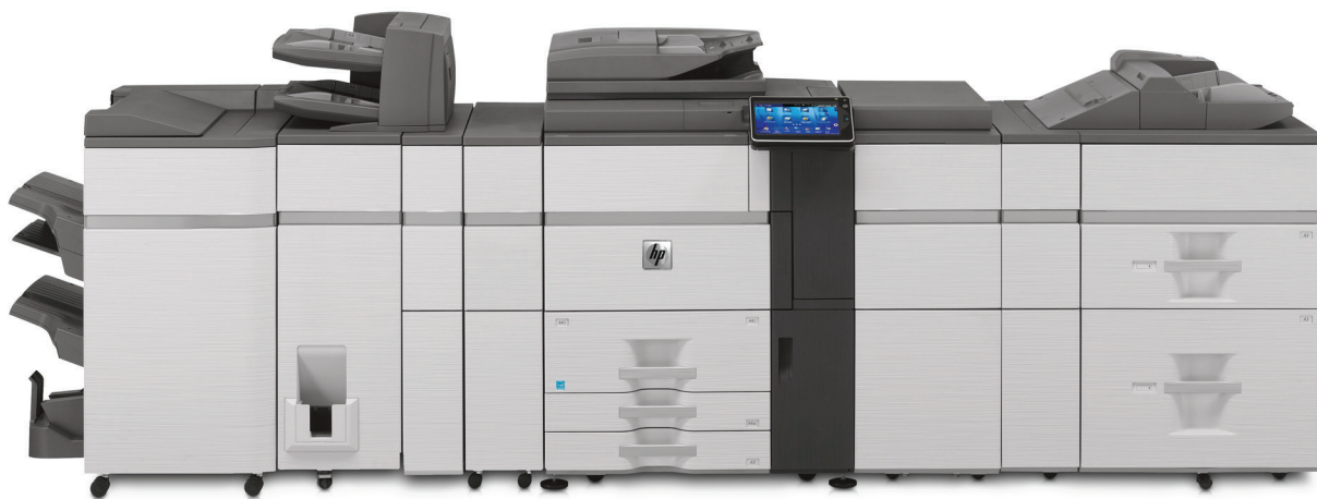
HP Color MFP S962dn – Exemple de configuration