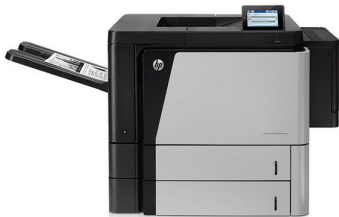
Impresora HP LaserJet empresarial M806dn

Esta HP LaserJet administra grandes trabajos de impresión de forma rápida, con capacidad de entrada extra grande y opciones de manejo de papel versátiles. La impresión móvil es una tarea simple con la tecnología de impresión en un toque (Touch-to-print) y la impresión inalámbrica directa. La facilidad de obtener actualizaciones protege su inversión. 1,2