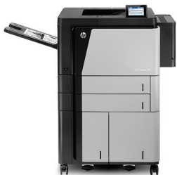
Impresora HP LaserJet Enterprise M806x+