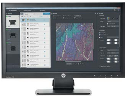
HP Designjet SmartStream

Especialmente projetado para departamentos de reprografia corporativos e bureaus de impressão para um gerenciamento fácil e correto de PDF, o HP Designjet SmartStream é uma solução profissional de software que reduz o tempo de preparação de trabalhos em até 50% em trabalhos complexos 4 e evita reimpressões com visualizações de impressão precisas.