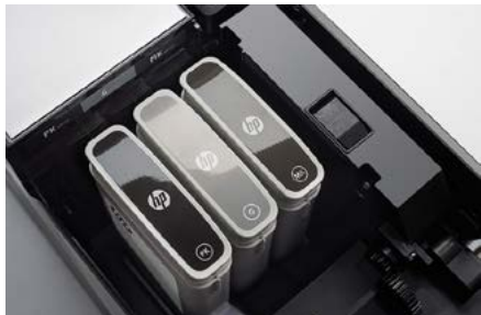
Conjunto de três tintas pretas da HP

Aumente a produtividade com a mais rápida multifuncional do mercado 1 para todas as suas necessidades em cores e preto e branco. Desfrute de uma operação sem supervisão a custos em preto e branco que competem com multifuncionais LED semelhantes. 2 Esta multifuncional foi criada para rigorosas demandas de TI e máxima segurança.