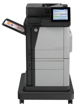
HP Color LaserJet Enterprise MFP M680f

Lide com trabalhos de alto volume com um multifuncional em cores de alto desempenho. Imprima e copie em tamanho Carta e A4, além de digitalizar e enviar fax. Recursos de digitalização aprimorados e uma tela de toque em cores de 8" suaviza os fluxos de trabalho. Opções de impressão móvel ajudam você a manter-se produtivo em trânsito. 2