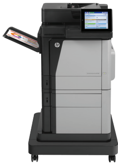
HP Color LaserJet Enterprise MFP M680f

Haga frente a trabajos de gran volumen con una MFP a color de alto rendimiento. Imprima y copie en tamaño carta y A4, y cuente con escaneo y fax. Los recursos de escaneo optimizados y la pantalla táctil a color de 8 pulgadas agilizan los flujos de trabajo. Las opciones de impresión móvil lo ayudan a mantenerse productivo fuera de la oficina. 2