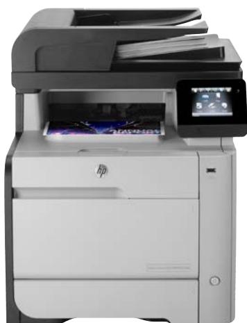
HP Color LaserJet Pro MFP M476 Series

Este HP Color LaserJet Pro MFP conecta todo o escritório para uma impressão em cores vibrantes, até mesmo em trânsito 1,3,4 – e melhora a produtividade com digitalização rápida e versátil que pode enviar documentos diretamente para o e-mail, pastas de rede e para a nuvem.