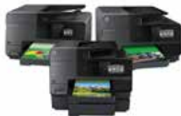
HP Officejet Pro 8610, 8620 e-All-in-Ones