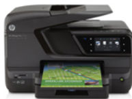
HP Officejet Pro 276dw MFP