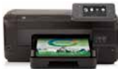
Officejet Pro 251dw