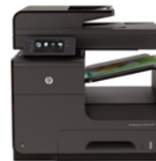
HP Officejet Pro X576dw MFP