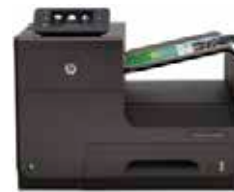
Officejet Pro X551dw