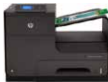
Officejet Pro X451dw