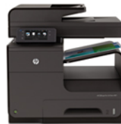
HP Officejet Pro X476dw MFPer