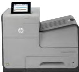
HP Officejet Enterprise Color X555dn

Une impression révolutionnaire pour votre entreprise. Produisez des documents en couleurs jusqu'à deux fois plus vite pour la moitié du coût des imprimantes couleurs laser. 1,2 Conçue pour une sécurité renforcée et une grande facilité d'administration, cette imprimante d'entreprise est construite pour durer.