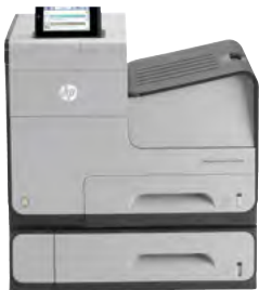
HP Officejet Enterprise Color X555xh