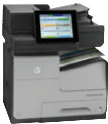
HP Officejet Enterprise Color MFP X585dn

A printing revolution for business. HP Officejet Enterprise MFPs deliver color prints at up to twice the speed and half the cost per page of color lasers plus copy, scan, and fax. 1,2,8 They're designed for advanced workflow—and built to last.