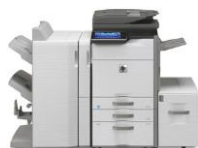
HP MFP S956dn