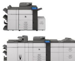
HP Color MFP S962dn (configuración básica/completa)