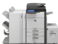
HP Color MFP S951dn