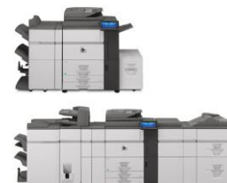
HP Color MFP S970dn (configuración básica/completa)