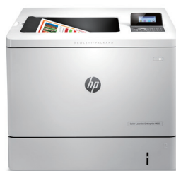
HP Color LaserJet Enterprise M553dnm 智能雷射彩色印表機