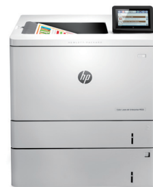
HP Color LaserJet Enterprise M553xm 智能雷射彩色印表機