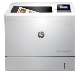
HP Color LaserJet Enterprise M552dn 智能雷射彩色印表機