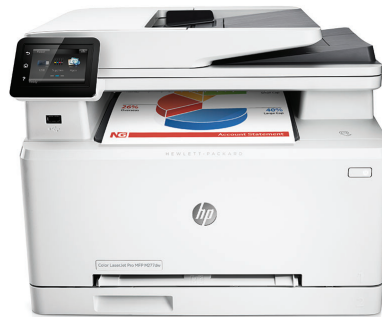
HP Color LaserJet Pro MFP M277dw

Óriási teljesítmény kis dobozba zárva. A funkciógazdag MFP készülék és a JetIntelligence technológiát használó eredeti HP tonerkazetták a feladatok elvégzéséhez szükséges minden eszközt biztosítanak.