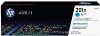
Cartuchos de toner HP originais com JetIntelligence

Os cartuchos de toner HP originais com JetIntelligence oferecem à sua empresa mais páginas, 3 desempenho máximo de impressão e a proteção adicional da tecnologia antifraudes — algo que os concorrentes simplesmente não conseguem oferecer.