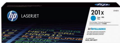
Original HP Tonerkartuschen mit JetIntelligence

Mit Original HP Tonerkartuschen mit JetIntelligence profitieren Sie in Ihrem Unternehmen von einer größeren Zahl an Ausdrucken, 3 höchster Leistung beim Druck und zusätzlichem Schutz durch Technologie zur Betrugsbekämpfung – Technologien, die Ihnen so kein anderer Hersteller bietet.