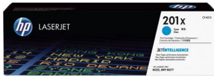
Cartuchos de tóner originales HP con JetIntelligence

Los cartuchos de tóner originales HP con JetIntelligence proporcionan a su empresa más páginas 3 , máximo rendimiento de impresión y la protección adicional que ofrece la tecnología antifraude: nuestros competidores simplemente no pueden igualarlo.