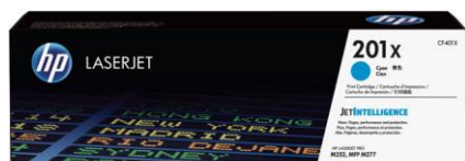
Cartucce toner HP originali con JetIntelligence

Le cartucce toner HP originali con JetIntelligence offrono alla tua azienda più pagine, 3 più prestazioni di stampa e la protezione aggiuntiva antifrode, caratteristiche con cui la concorrenza non può competere.