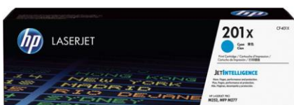
Cartucce toner Originali HP con JetIntelligence

Le cartucce toner Originali HP con JetIntelligence offrono alla tua azienda più pagine, 3 più performance di stampa, e la protezione aggiunta antifrode, caratteristiche con cui la concorrenza non può competere.