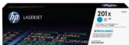
Cartuchos de toner HP originais com JetIntelligence

Os cartuchos de toner HP originais com JetIntelligence oferecem à sua empresa mais páginas, 3 desempenho máximo de impressão e a proteção adicional da tecnologia antifraudes — algo que os concorrentes simplesmente não conseguem oferecer.